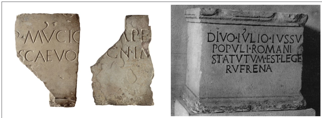
Figura 1. Inscripción dedicada a Mucio Escévola (Tarragona) y al Divus Iulius (Otricoli) (Fotos: MNAT y CIL/BBAW).

reconocimientos públicos oficiales de la Provincia Hispania citerior . Destaca la ingente colección de pedestales honoríficos de tipología estándar y característico módulo tripartito, el empleo casi sistemático del marmor local, la caliza rosada llamada piedra de Santa Tecla, la homologación de su lenguaje epigráfico, así como la fijación de los módulos en la ordinatio y la paleografía que permiten fechar de forma general entre el 70 y el 150/160 la mayoría de las inscripciones de esta etapa.