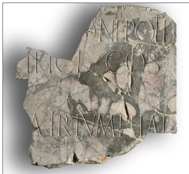
Figura 2. Inscripción de Druso en mármol de Teos (Tarragona).

Como muestra de esta línea de trabajo, hemos realizado una primera aproximación a la producción epigráfica precisamente en este arco cronológico, que incluye en torno a 80 documentos así datados en la nueva edición del CIL. Para su delimitación alta, partimos del corpus dedicado a las inscripciones republicanas de Hispania (DÍAZ ARIÑO 2008), en donde para la ciudad de Tarraco se recogen 21 entradas (contando en una misma entrada los dos textos de sendas inscripciones opistógrafas). Para su inclusión entre las inscripciones de época anterior a Augusto, y en los casos en los que no se ha podido contar con datación interna, los elementos discriminantes se han basado en criterios de tipo onomástico, paleográfico y formulario (para las funerarias, por ejemplo, nominativo y fórmula hic situs est... ) e incluso tímidamente en el conocimiento del ya mencionado material, criterios que permitían acotar en el mejor de los casos grosso modo a mitades o mediados dentro de los siglos II y I aC., cuando no un genérico “finales de época republicana”. Uno de estos casos excepcionales es la ins-