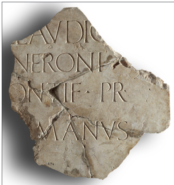
Figura 3. Inscripción de Tiberio en piedra de Santa Tecla (Foto: MNAT).