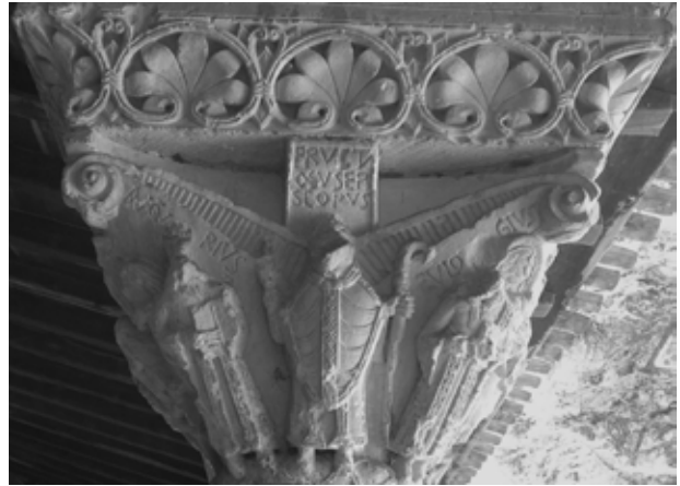
Figura 2. Capitell del claustre de la prioral de Saint Pierre de Moissac.

Avui tenim informació precisa sobre la ubicació d'aquesta església gràcies a la documentació escrita i cartogràfica de la Tarragona moderna. L'any 1563, el cronògraf A. Van den Wyngaerde va realitzar diverses vistes panoràmiques de la ciutat, una de les quals fou projectada des del mateix terrat de Sant Fructuós (fig. 3) 27 . Durant la seva visita a la ciutat, va poder conèixer i treballar amb Pons d'Icart, qui també ens proporciona informació valuosa sobre aquesta església i el seu emplaçament. Pons d'Icart ens parla de la seva ubicació intramurs i la seva proximitat a la muralla, al port i a tot un seguit de ruïnes imponents del passat romà de Tarragona (fòrum municipal). Era a prop d'una porta d'accés a la ciutat romana; es trobava en un punt elevat i dominava sobre una extensa esplanada fins al riu, pavimentada amb grans lloses de pedra, coneguda amb el nom de