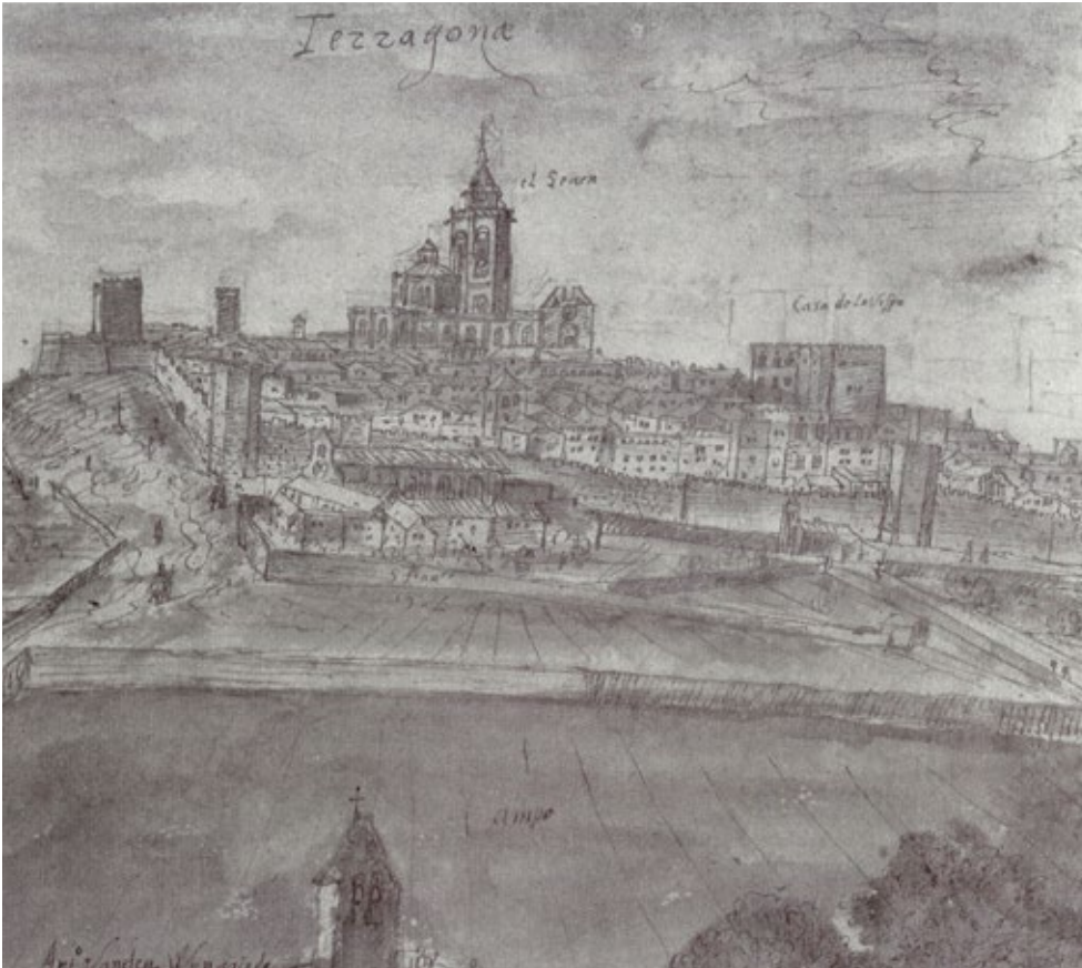
Figura 3. Vista de la ciutat de Tarragona des de la torre de l'església de Sant Fructuós segons A. Van den Wyngaerde (Kagan 1986, p. 179).

l'església medieval de Sant Fructuós havia estat el més sumptuós de Tarragona després de la catedral de Santa Maria. Així ho recull la versió original en català: "ediffici de temple antic més sumptuós jo no'l veyg en Tarragona, que apres de la Seu se'n mostra de major, que és lo de Sant Fructuós" 33 .