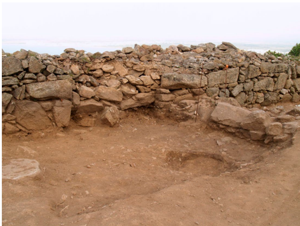
FIGURA 8. Tramo sudoccidental de la muralla, con una puerta de acceso abierta en la segunda fase.

Por último, como novedad de esta campaña, podemos anunciar que hemos empezado a ubicar con exactitud el tramo de muralla noroccidental. Mediante un sondeo justo en el ángulo del circuito, hemos podido recuperar, a un metro de profundidad, un segmento de la muralla cuyo trazado discrepa del muro de cierre actual. Todo el sector ha sido remodelado en diversas ocasiones, fundamentalmente para definir el recorrido de la