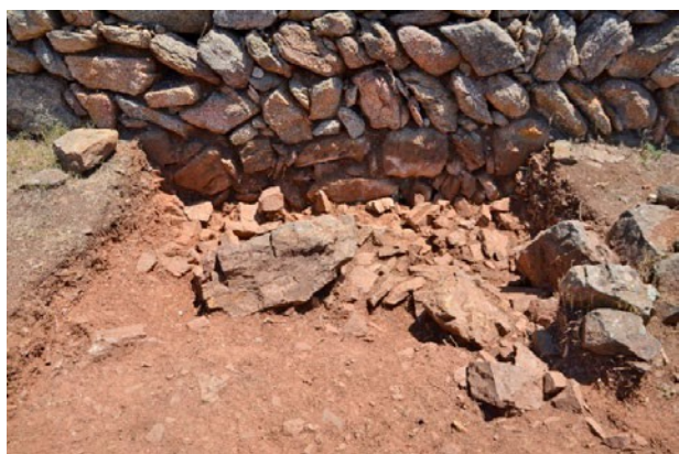
FIGURA 5. Drenaje contra la muralla en el sector sudoriental.

cavando incluso en ocasiones una trinchera de cimentación, encontramos un sistema de drenaje y protección del muro: se dispusieron paquetes de piedras y lajas que, colocados de forma irregular, dejaban numerosos resquicios por donde el agua