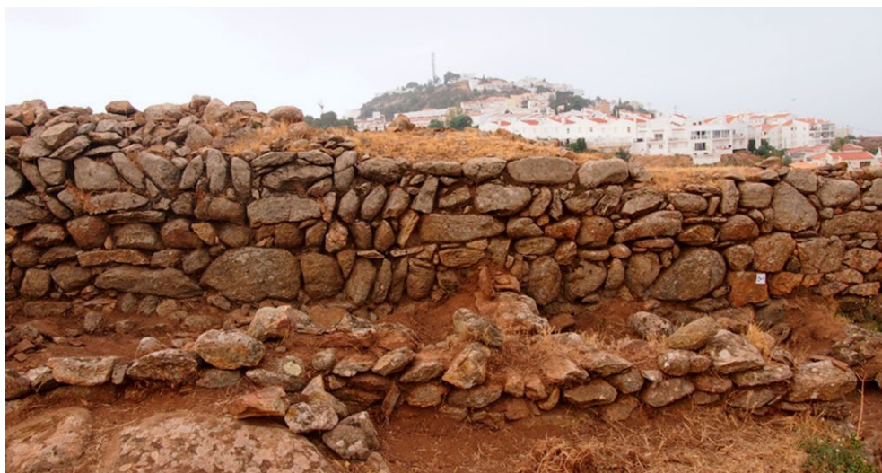
FIGURA 6. Disposición alternando la dirección del mampuesto con cuñas de contrarresto.