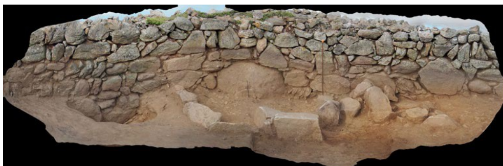
FIGURA 7. Contrarresto horizontal del muro a partir de los bloques de forma triangular. Obsérvese también como la muralla cabalga sobre los bolos graníticos.

largo de todo el tramo el terreno presentará este tipo de situaciones y la muralla se adaptará, dándose inevitablemente cierta ondulación de las hiladas.