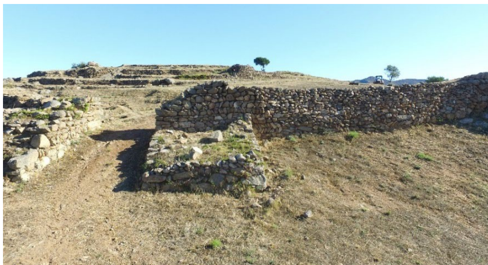
FIGURA 3. La torre número 2, que flanquea la entrada al yacimiento, se entrega a la muralla solo puntualmente.

A propósito de la hidráulica del yacimiento, hay que señalar que a lo largo de todo el recinto se encuentran desagües que atraviesan la muralla, y que aparecen situados alrededor de medio metro por encima de los niveles de circulación actual. Son pequeñas aberturas con dintel por la parte superior, definidas con precisión a pesar del material heterogéneo de la construcción. Nuestros predecesores hablaron de ventanas (Palol 2004, fig. 9) porque en algún caso daba la sensación de que el conducto se encontraba muy alto, pero se