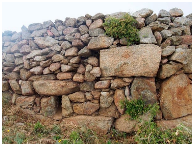
FIGURA 4. Conducto de desagüe en el tramo occidental de la muralla y junta sin trabar en el ángulo.

Además de los desagües señalaremos que se tomaron otras medidas para combatir los efectos de los aguaceros. En los puntos en los que hubo que cavar un poco para cimentar la muralla, ex-