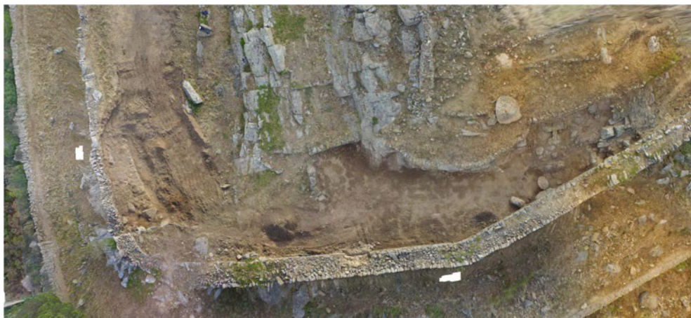
FIGURA 9. Vista cenital sobre el macizo granítico, con recortes en la roca e indicios de construcciones.

visita turística, que constituye al mismo tiempo un muro de contención para frenar la erosión del yacimiento. Por ello, es difícil documentar la forma de la muralla en este ángulo. Sin embargo, la disposición de algunos grandes bloques nos permite aventurar que estamos delante de los cimientos de una torre de ángulo hoy día desaparecida.