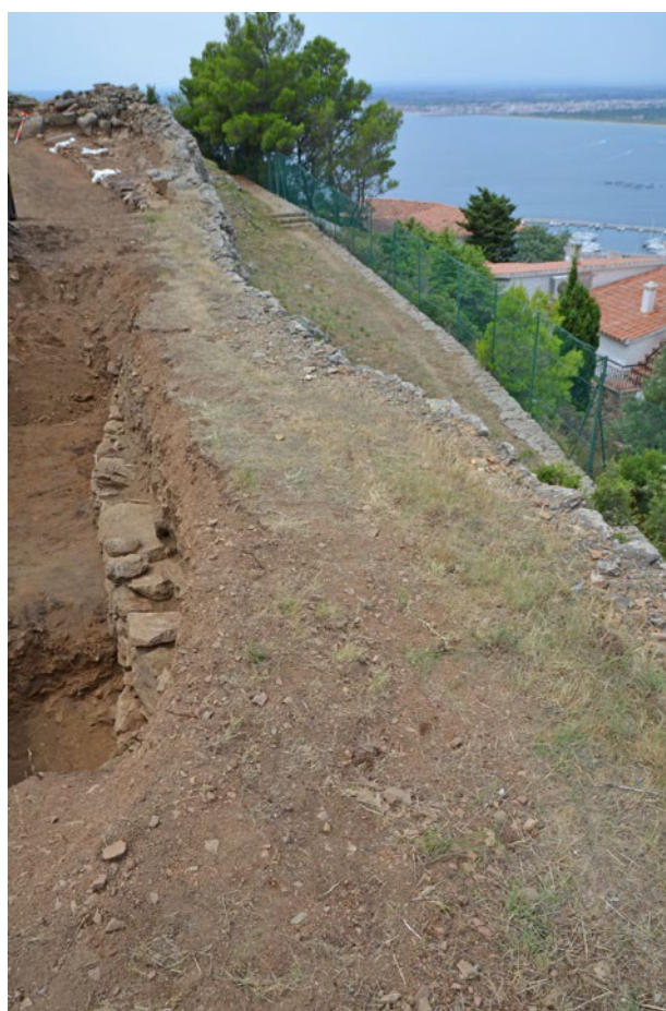
FIGURA 10. Tramo noroccidental del recinto, con la muralla original enmascarada por los sedimentos y el talud.

Frente a la visión tradicional del asentamiento, se han producido ligeros cambios que amplían la vida del yacimiento y por lo tanto su significación histórica, aunque es obvio que quedan muchos aspectos por resolver. En primer lugar, ciertamente, la cronología inicial de la muralla, para la cual todavía falta precisión. A lo largo de las excavaciones de Palol aparecieron algunas cerámicas de importación que se pueden adscribir a finales del VI; 9 sin embargo, la falta de contextos claros puede indicar una presencia residual que no sea significativa. A este dato fundamental, cabe añadir la constatación de una reforma del poblado que se visualiza a partir de la sucesión entre silos y habitaciones y que podría haber sido coetánea de la