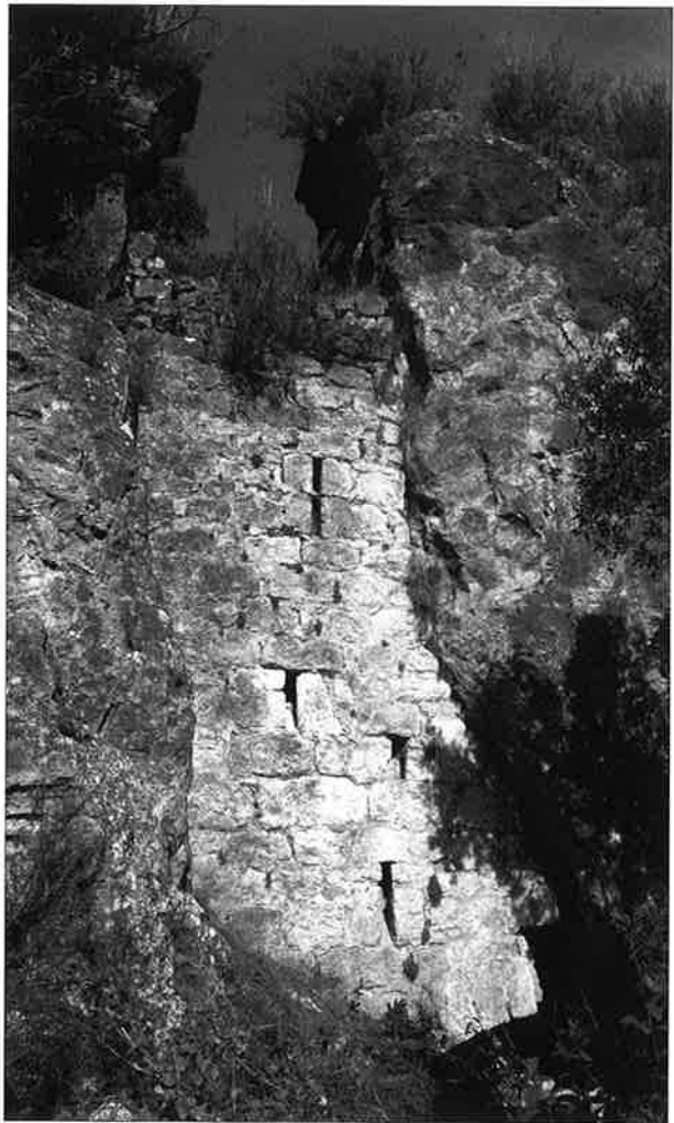
Figura 2: detall de l'accés. A la part inferior es pot observar l'arc de quart de cercle que formaria part de la portalada. (J.M. Vergès).