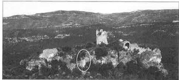
Figura 1: Vista general del castell de Pinyana on s'indica la situació de l'accés fortificat. (J.M. Vergès).

Davant dels dubtes que ens plantejava l'accés per l'extrem meridional, portàrem a terme una anàlisi acurada del perímetre del castell cercant altres possibilitats. Aquesta va permetre documentar un accés situat a la part central del pany de muralla oriental, en el punt on aquesta arriba fins al peu de la paret rocosa. Aquesta ubicació s'allunya de la proposada fins ara, i canvia alhora la interpretació donada a aquest punt. A la Guia dels castells del Gaià s'esmenta aquest indret, i es fa notar que la muralla reposa sobre un arc, però a aquest arc no se li atribueix cap altra funció que la de sustentació: "La irregularitat del relleu obliga a salvar una profunda escletxa vertical mitjançant la construcció d'un arc de mig punt on es recolza el basament de la muralla." (MIQUEL,