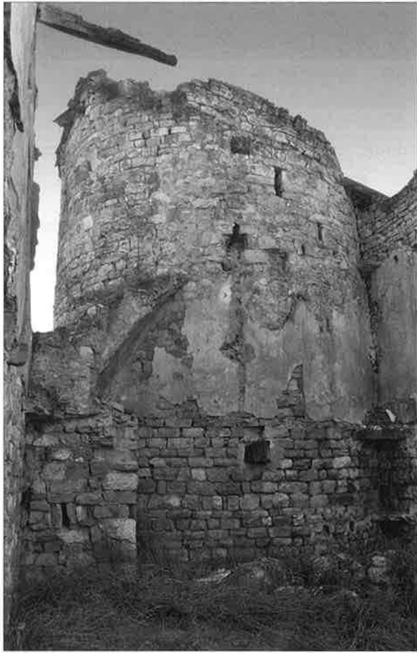
Figura 2.: façana septentrional de la torre d'Esblada. Es pot observar que la torre es troba inclosa dins d'una construcció posterior. (J.M. Vergès).

En un moment difícil de precisar, possiblement al segle XVI, es construí un gran casal que la va absorbir, escapçant-la, i ensorrant, com hem dit, la meitat meridional per encabir-hi una habitació. La cara interna de la torre va quedar també molt malmesa. Actualment els enderrocs cobreixen bona part de l'estructura, cosa que dificulta aixecar-ne una secció completa.