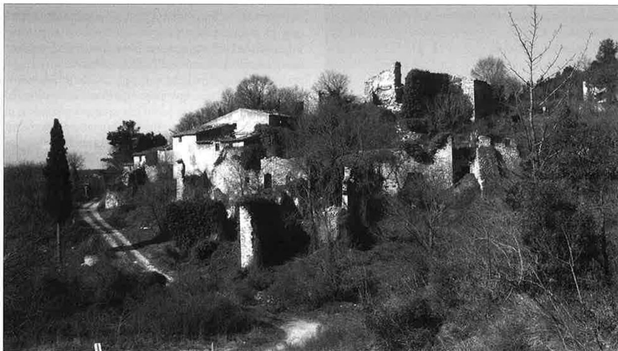
Figura 1: vista general d'Esblada. La part superior de la torre presenta un retall esbiaixat a causa de la teulada de l'edifici que se li annexà. (J.M. Vergès).

Jordi López*, Marta Fontanals, Josep Maria Vergès**, Josep Zaragoza***