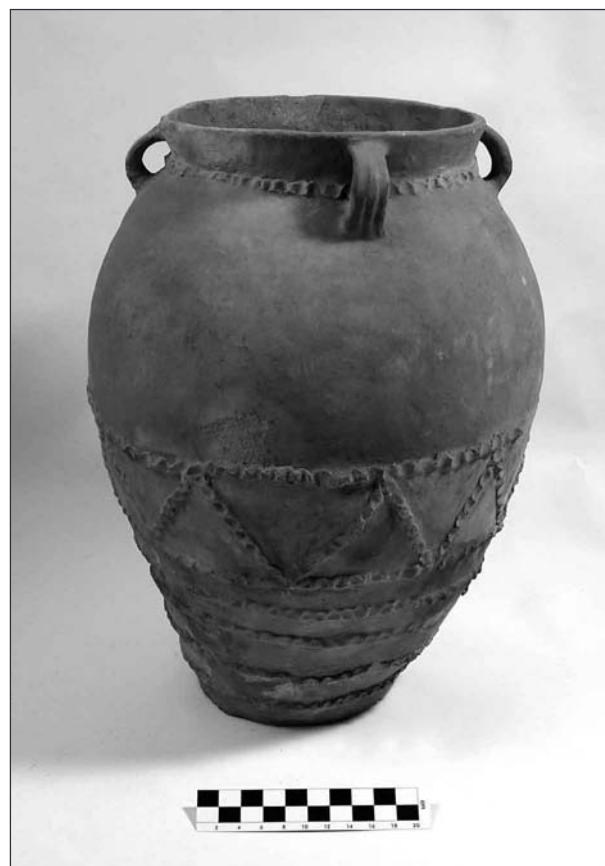
FIGURA 2. Imitación de pithos procedente de San Cristóbal (Mazaleón, Teruel).

A diferencia de otros territorios, el área del Ebro (en el amplio sentido con el que aquí la analizamos) no presenta –por el momento– grandes estructuras de almacenamiento de grano ni lagares, que testimonien la explotación intensiva de los recursos agrícolas. La presencia de molinos de vaivén demuestra una explo-