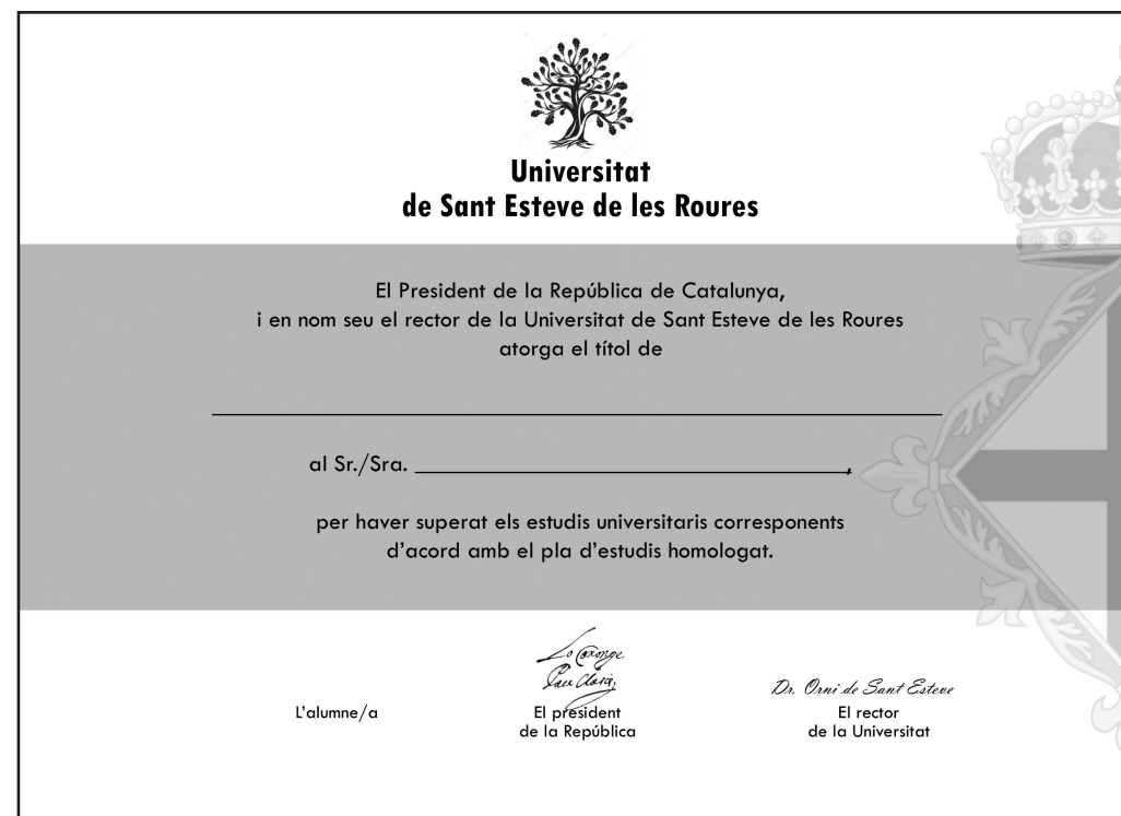
Figura 1. Títol universitari, personalitzable, expedit per la Universitat de Sant Esteve de les Roures.