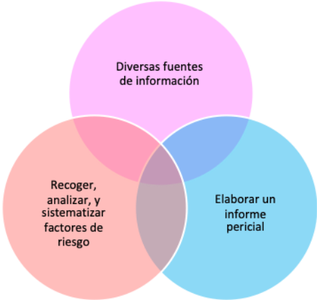
Figura 1. Metodología del Juicio Profesional Estructurado.

1 2 3 4 5 6 7 8 9 10 11 12 13 14 15 16 17 18 19 20 21 22 23 24 25 26 27 28 29 30 31 32 33 34 35 36 37 38 39 40 41 42 43 44 45 46 47 48 49 50 51 52 53 54 55 56 57 58 59 60 61 62 63 64 65