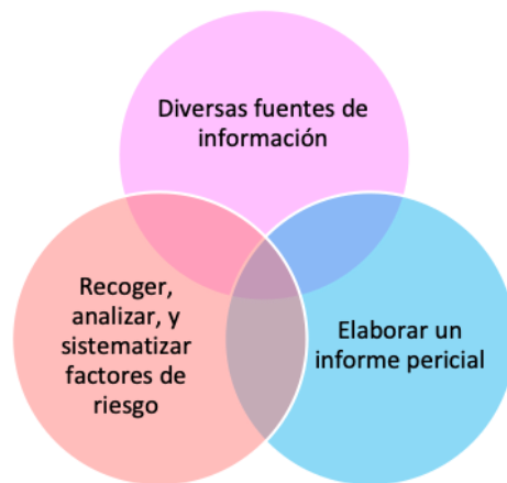
Figura 1. Metodología del Juicio Profesional Estructurado.