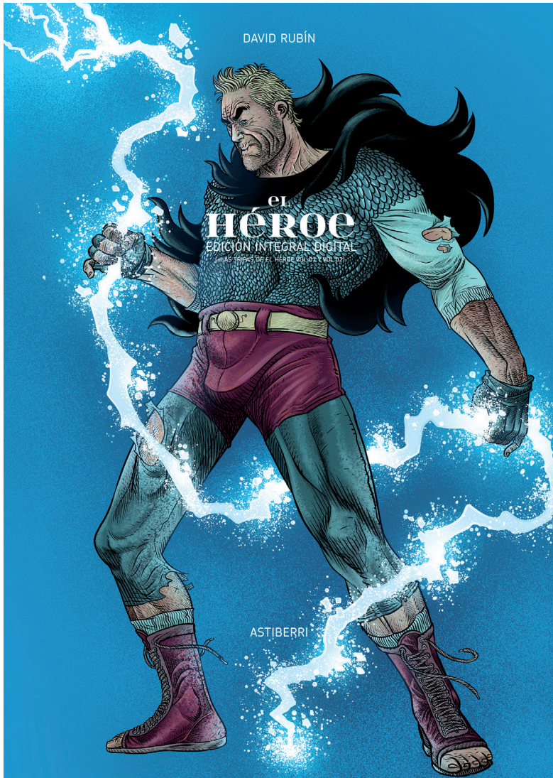
Imatge 5. Coberta de l'edició integral digital d'El héroe (Astiberri, 2021).