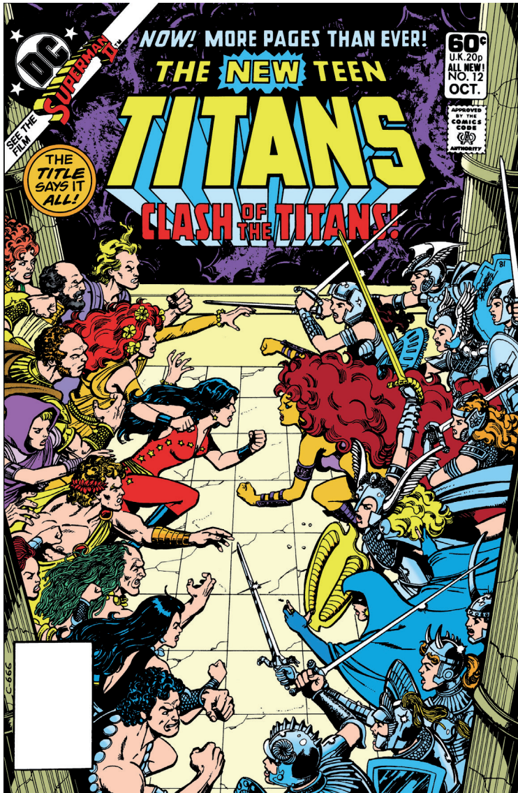
Imatge 8. Coberta del núm. 12 de The New Teen Titans (DC, octubre de 1981), amb la història «Clash of the Titans».