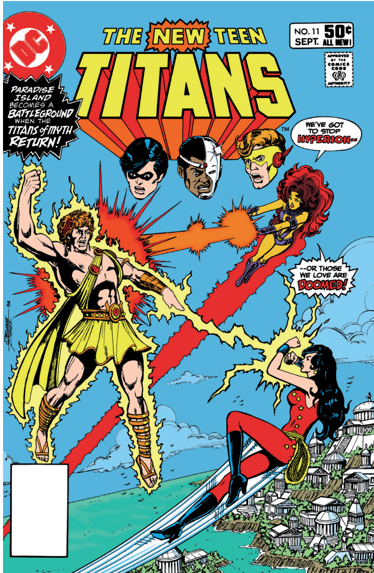
Imatge 7. Coberta del número 11 de The New Teen Titans (DC, setembre de 1981) amb la història «When Titans Clash».