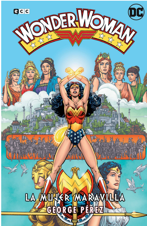
Imatge 1. Coberta de Wonder Woman de George Pérez: La Mujer Maravilla-Saga completa . (ECC, novembre de 2021).

l'editorial ECC, que té els drets de publicació a l'Estat espanyol de l'editorial DC, ha recuperat en un únic volum de gairebé set-centes pàgines aquesta etapa completa (vegeu la imatge 1). 20