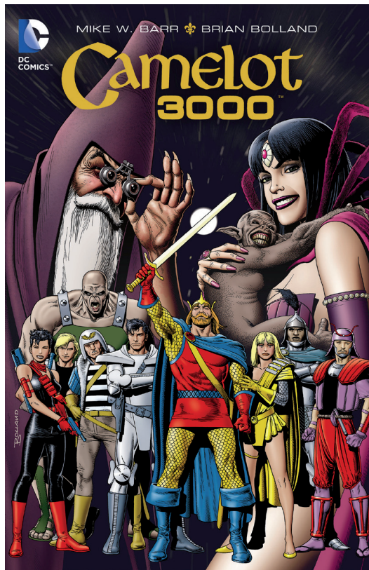
Imatge 4. Coberta de Camelot 3000: The Deluxe Edition (DC, 2008).

Un altre exemple de versió de mite que podem llegir en còmic és Camelot 3000 , amb guió de Mike W. Barr i dibuix de Brian Bolland. Es tracta de la primera maxisèrie de còmics publicada per DC, apareguda originàriament en dotze números entre els anys 1982 i 1985, i recopilada posteriorment en un únic volum, en edicions diverses, com l'anomenada Deluxe , publicada per DC l'any 2008, que inclou, entre altres materials extres, una introducció del guionista de la sèrie (vegeu la imatge 4). El còmic segueix les aventures del rei Artur, Merlí i els cavallers de la Taula Rodona en un futur distant, quan aquests personatges tornen a sorgir, reencarnats, en un món superpoblat l'any 3000 dC per lluitar contra una invasió extraterrestre ideada per la seva vella nèmesei, Morgana le Fay.