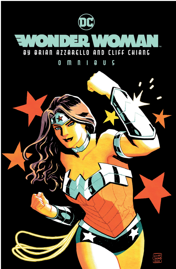
Imatge 2. Coberta de Wonder Woman by Brian Azzarello and Cliff Chiang Omnibus (DC, maig de 2019).