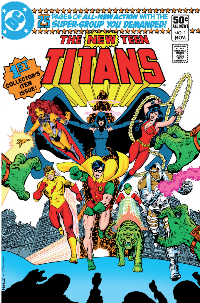
Imatge 6. Coberta del núm. 1 de The New Teen Titans (DC, novembre de 1980).

Els Titans són un grup de superherois adolescents, molts dels quals han actuat com a acompanyants dels superherois principals de DC a la Justice League. Aparegut per primera vegada el 1964 a The Brave and the