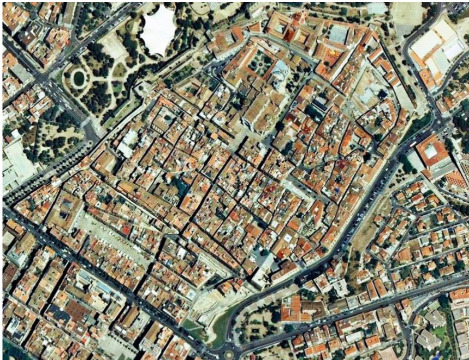
Fig_2 Vista aérea de la Part Alta de la ciudad de Tarragona.

En este orden de cosas, uno de los explícitos atractivos, pero quizá también una de las deficiencias, de Tarragona es que el turismo espera encontrar –y encuentra– una ciudad llena de portentosos restos arqueológicos romanos. Ese legado valiosísimo llega a eclipsar el resto de la herencia patrimonial porque se ha construido una imagen urbana simplificada, que es la que el turismo conoce previamente, que espera hallar y reclama visitar.