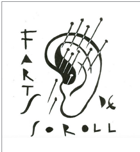
Fig_3 Logo de la plataforma vecinal Farts del Soroll

Ciertamente, el caso de las terrazas en el centro histórico nace en buena parte de la demanda de los establecimientos para incrementar los ingresos en el peor momento de la crisis del 2008. La decisión de contribuir a mantener este sector de servicios ha comportado también el abuso en el uso del espacio patrimonial. La reacción municipal por fortuna va en el sentido de regular los usos y los abusos en los espacios. Por esta razón se ha iniciado un proceso de participación ciudadana mediante Cívica Tarraco y se está cerrando una nueva propuesta de normativa de usos.