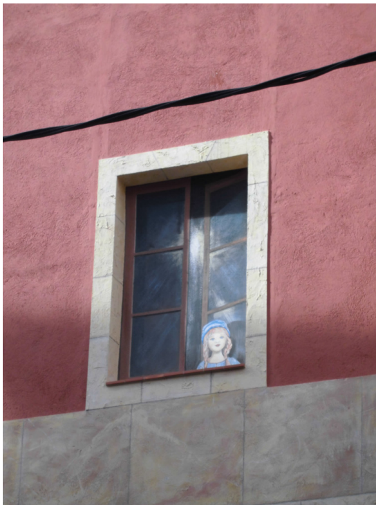
Fig_6 Trampantojo en la casa de la Plaza de l'Oli como exponente de recuperación de fachada con decoraciones tradicionales del siglo XIX.

Sumemos el problema de los apartamentos turísticos y las necesidades de equipamientos hoteleros porque el número de plazas en la ciudad es sensiblemente bajo. La administración municipal no tiene las herramientas necesarias, pero sí que puede contribuir a la ordenación de estos problemas mediante el planeamiento urbanístico con las claves de la ordenación de los usos. Una modificación del plan general, en este momento en fase de aprobación inicial, permite la renovación arquitectónica sostenible del centro histórico, sujeto a la legislación patrimonial por supuesto, y marca los usos permitidos de los edificios. Y finalmente se han iniciado los trabajos previos a la redacción de un nuevo plan especial del centro histórico. Con ello, este espacio urbano dispondrá de un instrumento de ordenación urbanística sostenible y de acuerdo con las necesidades y prescripciones que marcan las legislaciones de Urbanismo y Patrimonio, en un espacio donde no sólo se halla una parte del Conjunto Arqueológico de Tàrraco, sino también otros elementos de patrimonio inmaterial reconocidos por la UNESCO como los castells o la cocina mediterránea. Y, sobre todo, pretendemos que siga existiendo un centro histórico palpitante donde se viva, se sienta, se trabaje, se rece y se relacione el crisol humano para una Tarragona del siglo XXI.