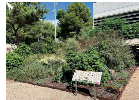
Figura 2. Jardín de las Mariposas en el Campus Sescelades de la Universitat Rovira i Virgili (Tarragona).

En la URV, a parte de la construcción y mantenimiento de estos jardines, se están realizando, entre otras acciones, campañas divulgativas dirigidas a la comunidad universitaria y la población general para contribuir al aumento de la biodiversidad de polinizadores y la mitigación de la degradación de sus hábitats en la ciudad. Entre ellos, destacamos por su impacto y acogida la propuesta de “Balcones verdes: la biodiversidad en tu casa”, en la que se presenta una guía práctica de cómo crear un espacio atractivo no sólo para las mariposas sino también para otros grupos de insectos como las abejas solitarias, abejorros, sírfidos, coleópteros, etc. en tan sólo un metro cuadrado de superficie. En cualquier caso, ya sea para la construcción de un Jardín de Mariposas más extenso o para la planificación de las plantas a colocar en los balcones o ventanas de los edificios, se siguen unos principios fundamentales comunes, que a continuación se detallan.