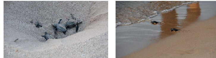
Figura 3. Emergencia y llegada al mar de neonatos. Playa del Miracle (Tarragona). Verano de 2021.

Ante la aparición de nidos de tortuga boba en nuestras costas y la tendencia creciente que han mostrado durante las dos últimas décadas se