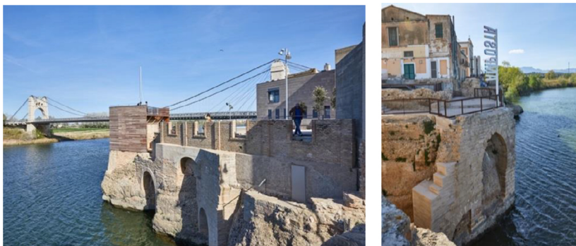
Figures 2 i 3. Celoquia del castell dels cavallers i vista de l'arc gòtic. Amposta.

recinte del castell, declarat bé cultural d'interès nacional, documenten evidències d'una fortificació andalusina i un assentament d'època ibèrica, amb la pervivència de tres fossars excavats i un arc gòtic sobre la roca del mur fluvial (Ajuntament d'Amposta, 2018 i 2022; Cervelló i Rodes, 2020).