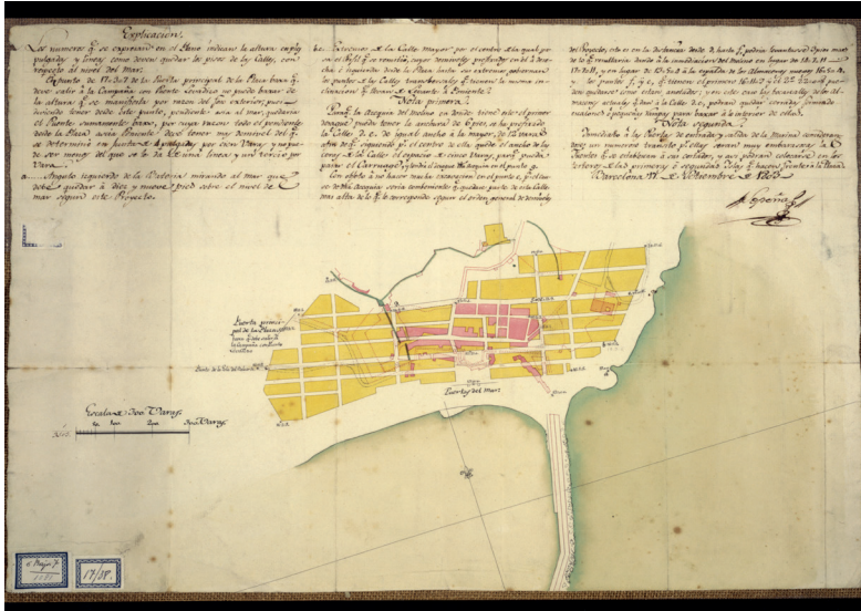
Figura 10. Planta de la playa del puerto de Tarragona y proyecto de la nueva población. 17 de septiembre de 1803. Antonio López Sopena.

banda la fortificació i, d'altra banda, l'embelliment de la ciutat. Aquest últim aspecte va ser, en part, gràcies als arquebisbes Santiyán i Armanyà, els quals van fer prevaler la millora de la ciutat.