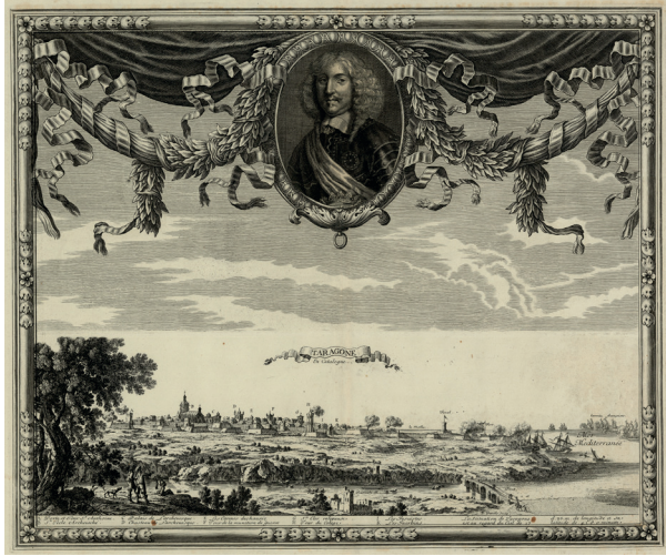
Figura 6. Taragona en Catalogne . Ca. 1659. Sébastien de Pontault. Institut Cartogràfic i Geològic de Catalunya.

Pel que fa als gravats elaborats per espanyols i catalans, aquests també són força nombrosos. Els catalans Francesc Tramulles (1722?-1773) i Josep Prat (c.1730-1788) el 1765 van crear una sèrie d'estampes de la ciutat emeses amb el motiu del trasllat de la relíquia de Santa Tecla a la ciutat (Mata de la Cruz, Sofia, 2012; Ortueta Hilberath, 2006: 15). Les vistes mostren la ciutat emmurallada percebuda com una plaça forta, amb les esglésies i els convents. D'altra banda, existeix un gravat de 1781 elaborat per Antoni Pons que mostra una perspectiva de la ciutat vista des del mar (fig. 7). Aquest gravat es troba publicat en l' Atlante Español , i dos segles més tard en el tercer volum de la Geografia General de Catalunya (Espinalt y García, 1778-95; Morera Llauredó, 1899). S'hi representa la Torre del Port (identificada com a Torre del Moll amb el número 20) i l'escullera medieval al seu costat. Hi destaca la presència de casetes o petits edificis just en l'arrencada del moll, i la gran formació sorrenca a la platja. Aquesta platja discorre al llarg de les barraques de pescadors.