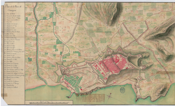
Figura 9. Plano de la Plaza de Tarragona . 1749. Miguel Marin. Cartoteca del Archivo General Militar de Madrid. Signatura: T-20/10

La informació d'aquest fragment casa perfectament amb alguns plànols de l'època i posteriors. En destaca la precisió de la descripció de Jaramas pel que fa a aquests plànols en concret, en els quals s'aprecia perfectament el final del moll amb tres grans pedres (fig. 9).