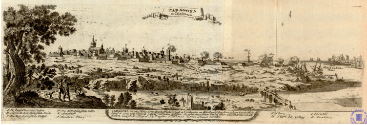
Figura 5. Taragone in Catalonien . 1717. Gabriel Bodenehr. Institut Cartogràfic i Geològic de Catalunya.

tulada Taragone in Catalonien (fig. 5). Bodenehr fou un editor, cartògraf i gravador alemany, conegut pels seus plànols i vistes de ciutats. Una de les seves obres mostra una vista de Tarragona des de la part dreta del riu, amb el pont que creuava el Francolí en primer lloc. S'hi assenyalen importants edificis i convents, així com la catedral. El gravat representa l'entrada dels vaixells aliats el 1705 durant la Guerra de Successió.