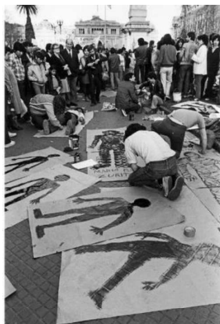
Imagen 4: Eduardo Gil (1983): El siluetazo .

social evidente parecen confirmar que la creación visual puede estar en perfecta sinergia con los movimientos sociales amplios. Baste evocar experiencias hartamente conocidas como la Agrupación de Plásticos Jóvenes (APJ) chilena, con su actividad de acción gráfica y performance callejera, el Taller 4 Rojo en Colombia, que desplegó su actividad sirviéndose de la serigrafía, los carteles, la acción gráfica, portadas de revista, o la participación de artistas en el ciclo de protestas Tucumán Arde en Argentina. Podríamos incluso hablar de una forma (que hoy nos puede parecer rudimentaria) de “acción conectada” antes de internet: el Mail Art jugó un papel destacado a la hora de conectar públicos amplios más allá del museo o la galería, de la mano de artistas como Guillermo Deisler, el colectivo Solidarte/México, o Paulo Bruscky.