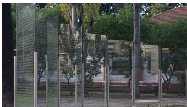
Imagen 3: León Ferrari (2013): Carta Abierta a la Junta Militar. Espacio por la Memoria y Derechos Humanos, Buenos Aires.

Los modos de producción y distribución de estas acciones son precarios, cuando no marginales: sus soportes gráficos son la serigrafía, la fotocopia, la fotografía y el propio cuerpo. En este sentido, una práctica constante es la subversión de la publicidad y el desarrollo de una gráfica política “popular”. Algunas de estas acciones se dispersaron en el cuerpo social al punto de que su origen artístico se olvidó. Otras fracasaron en su objetivo político, pero aún actúan como construcciones en la memoria colectiva. (RedCsur, 2016: 37)