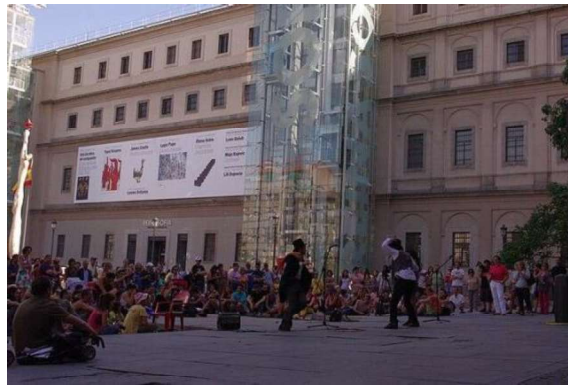
Imagen 1: jornada abierta de debate y creación, 25 de junio de 2011, ante el Museo Nacional Centro de Arte reina Sofía en Madrid.

Instantes en los que los individuos se aúnan en lo colectivo, en la fiesta y en la insurrección, generando una experiencia de fuerza compartida. Las movilizaciones se nos aparecen como fiestas populares de alegría o quebranto; en tanto que experiencias de liberación y catarsis; como grandes espectáculos participativos; cual rituales de un credo laico. Enlazando con las experiencias de insurrección del pasado y tratando de prefigurar escenas del futuro, su temporalidad mezcla lo lineal y lo circular, habitando una poética común de la revuelta. (Ramírez-Blanco, 2021:17)