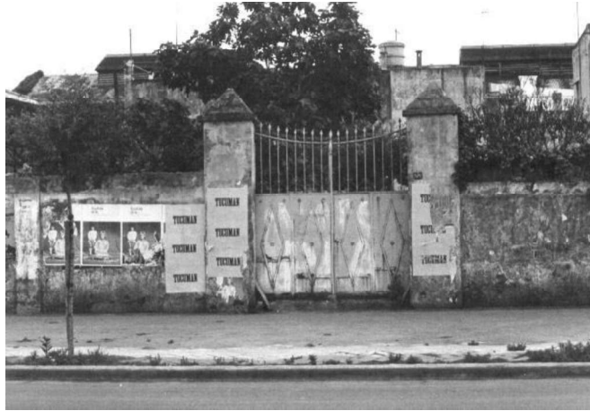
Imagen 5: Autor desconocido (1968): Acción masiva de encolado de carteles en Rosario (Argentina) durante el ciclo Tucumán Arde. Fuente: Wikimedia Commons.

dificultad de evaluar los resultados reales a largo plazo entre los participantes, así como a los problemas que pueden surgir en la relación entre los distintos profesionales y participantes implicados en los proyectos. También en este caso América Latina nos aporta experiencias exitosas que han trascendido en la escena internacional. Es particularmente conocido el caso de Brasil, donde las artes han contribuido a paliar de forma efectiva la marginación en los barrios desfavorecidos de las grandes urbes. Como nos recuerda Yúdice (2002) evocando ejemplos como el de José Junior y Afro-Reggae en Brasil o los Zapatistas en México, el papel de la cultura en relación a la justicia social puede ser bien tangible. En algunos casos no se trata sólo de una contribución simbólica de los artistas al empoderamiento moral de los participantes, sino que los proyectos se traducen en puestos de trabajo y oportunidades profesionales con las que antes no contaban.