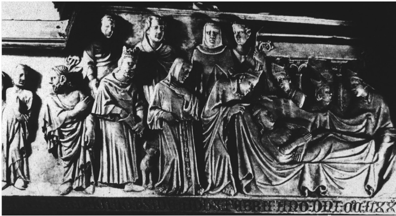
Fig. 5. Sarcófago de Santa Eulalia, detalle de la cubierta : Pedro IV, Elisenda de Montcada y Jaime III de Mallorca. c. 1327. Serie 28, n. 40.

significado político del acontecimiento religioso se explicita en la crónica, pero también en el relieve historiado de la tapa del relicario (Fig. 5) donde es posible identificar, entre los efigiados, a Elisenda de Montcada y al rey de Mallorca, quienes observan al rey de Aragón dispuesto a tocar los restos de la santa directamente y sin guantes; el mismo proclamó: “llevamos el dicho cuerpo santo en nuestras manos” 163 . Después hubo un convite, del que destaca que “estuvimos en una solemne mesa un total de veintiuno”, y especifica que en las otras se dispusieron gran número de condes, vizcondes, nobles y caballeros “puesto que en aquellos tiempos todavía no era costumbre que caballero alguno comiese con nosotros” 164 . Probablemente con el rey estarían los arzobispos y obispos participantes en la efeméride 165 , junto con el prescriptivo médico 166 , sentados en bancales con paños de lana obrados y sus cojines de tejido de oro y terciopelo con sus armas reales, como determinan sus ordinacions 167 . Esta suntuosidad se haría extensiva en la mesa, donde estaría la vajilla de oro y de plata, “la que acostumbramos a usar en palacio” 168 , y en la que se servirían “los mejores alimentos que se puedan encontrar”, procurando diversidad y variedad 169 . Seguramente todo estaría aderezado con una actuación musical al principio y al final del convite, y quizás con interludios sonoros que marcaban los ritmos de las comidas 170 .