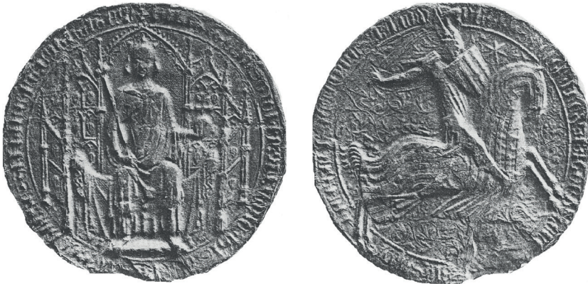
Fig. 4. Flahó o sello mayor. Pedro IV. 1343-1344.

Pedro el Ceremonioso vivió en un contexto bélico contra Francia, Castilla y Mallorca, que anexionó a su propio reino. En lo que atañe a su presencia resultan elocuentes sus ordenaciones, donde establece que, de forma congruente a su persona y dignidad, las armaduras que cubran su cuerpo sean pulcras y bellas, sin corrosión, oxidación o deterioro alguno. Custodiadas por el armador real, debían repararse o hacerse nuevas, y estar preparadas para cualquier ocasión incluidas las secretas “que podamos llevar en lugares oportunos”, junto con otras que, propias del rey, debían colocarse cerca de su cama 140 . Era prescriptivo anotarlas en el Llibre de notaments , donde se inventariaban sillas, frenos, espuelas, espadas del armador real, corazas, yelmos, cubriciones del cuerpo, espalderas y lorigas de caballo y perpuntes 141 , elementos que se observan en los reversos de su sigilografía, donde el rey figura ecuestre (Fig. 4). Las descripciones del rey suelen ser escuetas: “nos ataviamos y nos guarnecemos” 142 , o “íbamos regulados y ordenados [...] aparejados para herir” 143 , aunque a veces sorprenden sus detalles: tras un difícil ascenso por las rocas para conquistar Mallorca, “cuando estuvimos arriba del todo, todo nuestro calzado estaba rasgado” 144 .