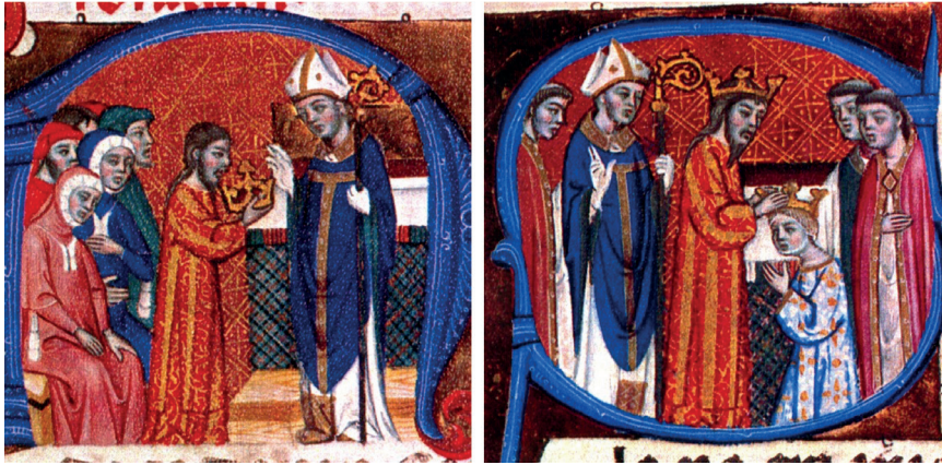
Fig. 2. Ceremonial de consagración y coronación de los reyes de Aragón, fols. 19r y 35v. 2 a ½ del siglo XIV.

Este acontecimiento, que el rey califica en su Crònica como “el más honrado que ningún otro que pudiese esperar en este siglo”, concluyó siendo aplaudido por los vasallos en el interior de la iglesia 37 . Salió en procesión, con un cetro de oro “muy bello” y un pomo, montando un caballo guiado por unas largas cadenas de plata. El séquito se ordenó por jerarquías, lo que suscitó ciertas protestas que el Ceremonioso, haciendo gala de su autoridad, pero también de su afectuoso talante, solventó reorganizando el orden para contentar a todos. Unos elegidos llevaban sus armas: la espada, insignia que tanto revalorizaría a lo largo de su reinado 38 , y el señal real. Las estancias de la Aljafería, lugar del convite, estaban encortinadas y empaliadas con ricos paños de oro, seda y otros materiales. Se ordenaron diversas disposiciones para el servicio del rey aquel día: en la primera redacción de su crónica el rey cita que, además de las formalidades señaladas, “se habían hecho hacer otras”, mientras que, en la versión final, explícita, queriéndose mostrar una vez más solemne y formalista, que fue él mismo quien las ordenó: “hicimos hacer otras”, recalca 39 .