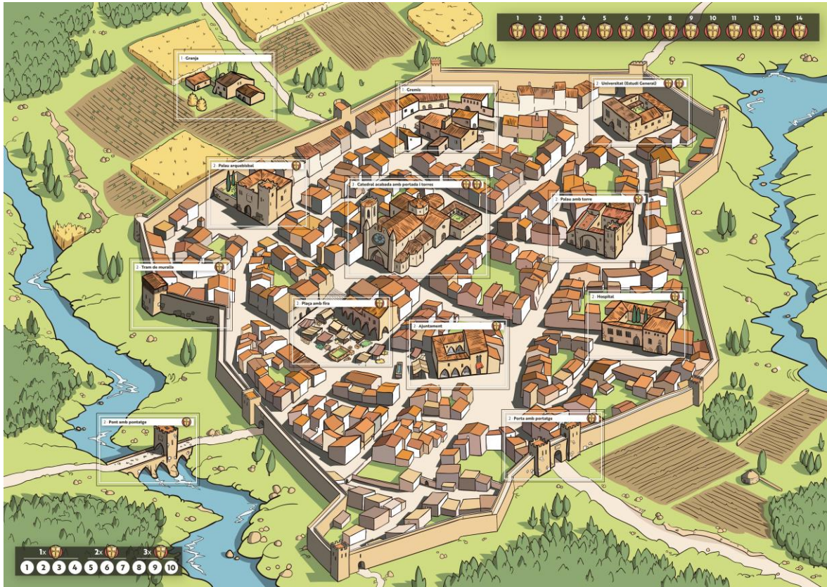
FIGURA 2: Tablero de Pactum