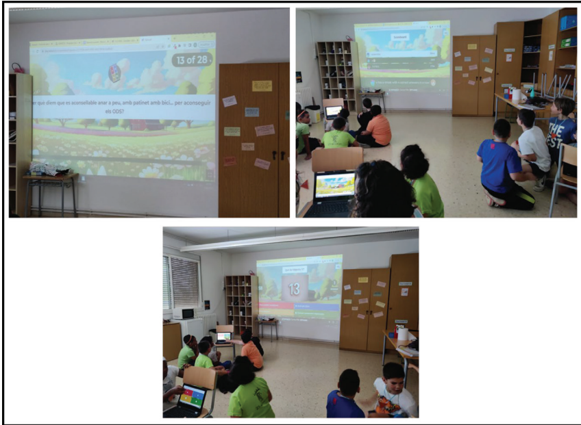
Figura 9. Imágenes de las actividades realizadas por el alumnado de Ciclo Superior