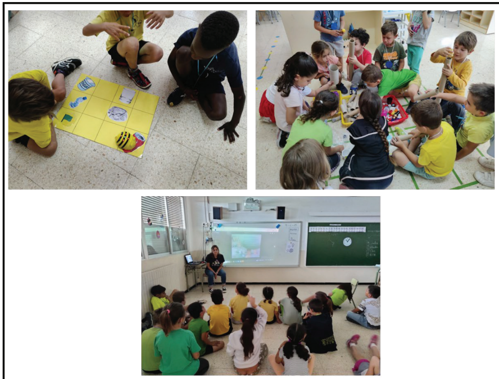
Figura 6. Imágenes de las actividades planteadas para el alumnado de Educación Infantil