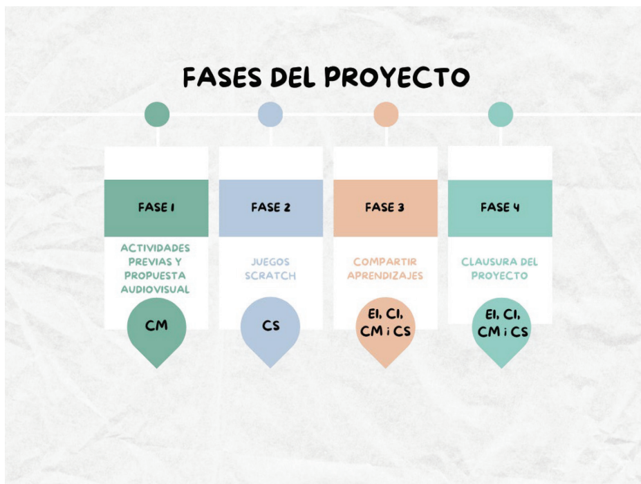
Figura 1. Se representan las fases del proyecto, el ciclo que participa y las actividades que se desarrollan

A continuación, se detallan las tareas que realizó cada ciclo (figura 2):