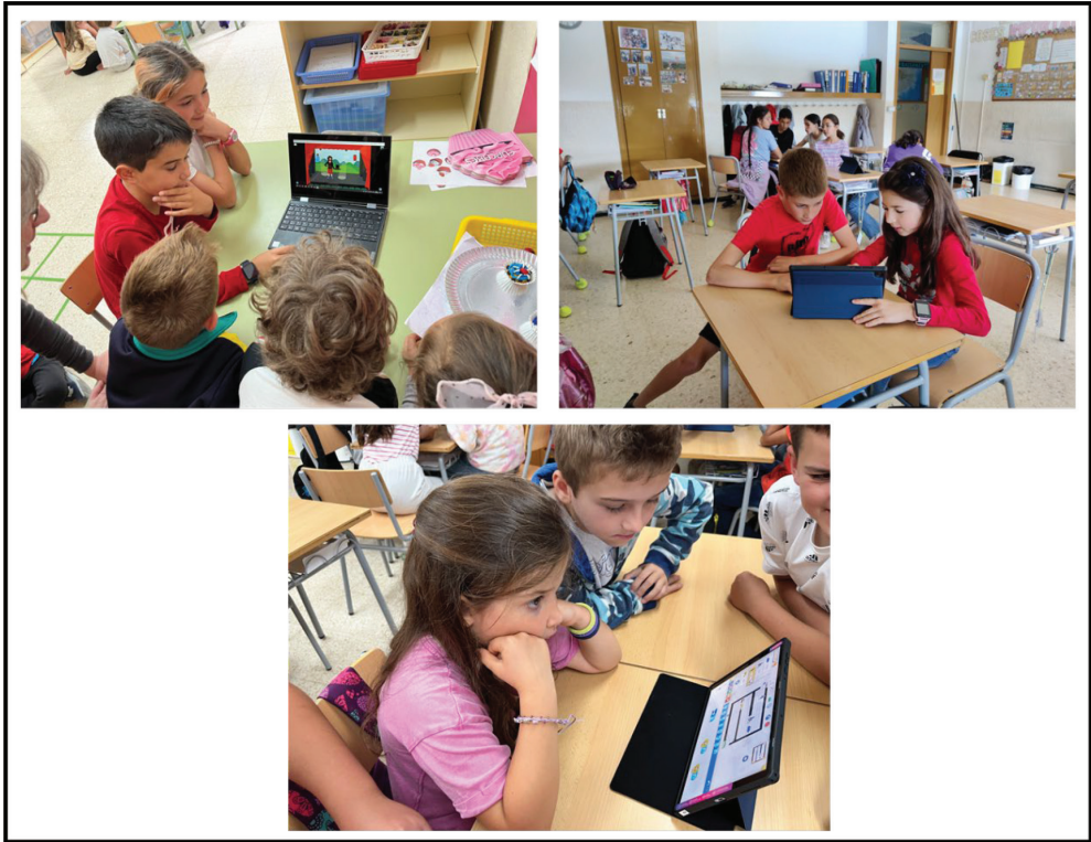
Figura 4. Alumnado de Ciclo Superior elaborando juegos ScratchJr