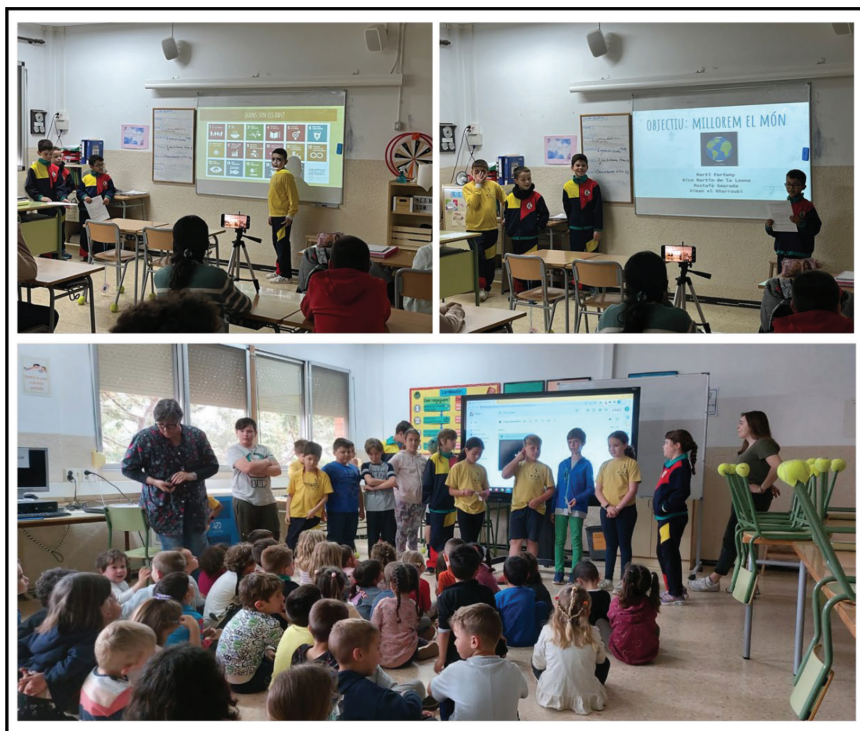
Figura 3. Alumnado de Ciclo Medio trabajando en la elaboración de las presentaciones y vídeos sobre los ODS

de elementos principales y también algunos ejemplos de juegos ya creados con la finalidad que pudieran coger ideas.