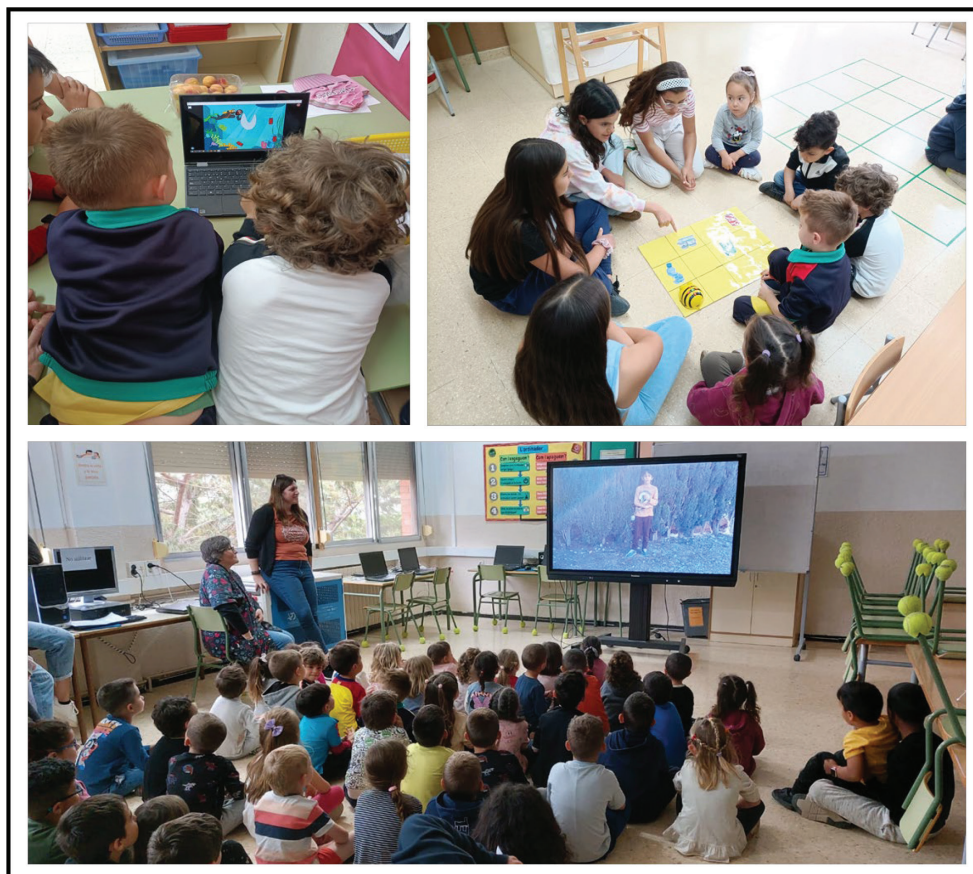
Figura 5. Alumnado de Educación Infantil y Ciclo Inicial visualizando los videos y jugando con los juegos de ScratchJr y con las bee-bots

se llevó a cabo en la Escuela San Ramón (escuela organizadora) el día 13 de junio a lo largo de toda la mañana.