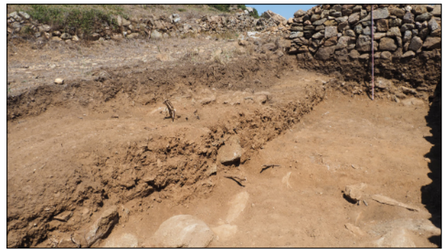
Figura 2. Vista de la rasa arran del mur modern PR23-1076, amb l'estratigrafia interior.

Els punt d'inici de la campanya del 2022 ha estat a tocar la torre número 8, pel costat nord, allà on la campanya anterior s'havia començat a veure l'existència d'una porta de la muralla tapiada. De manera que el primer