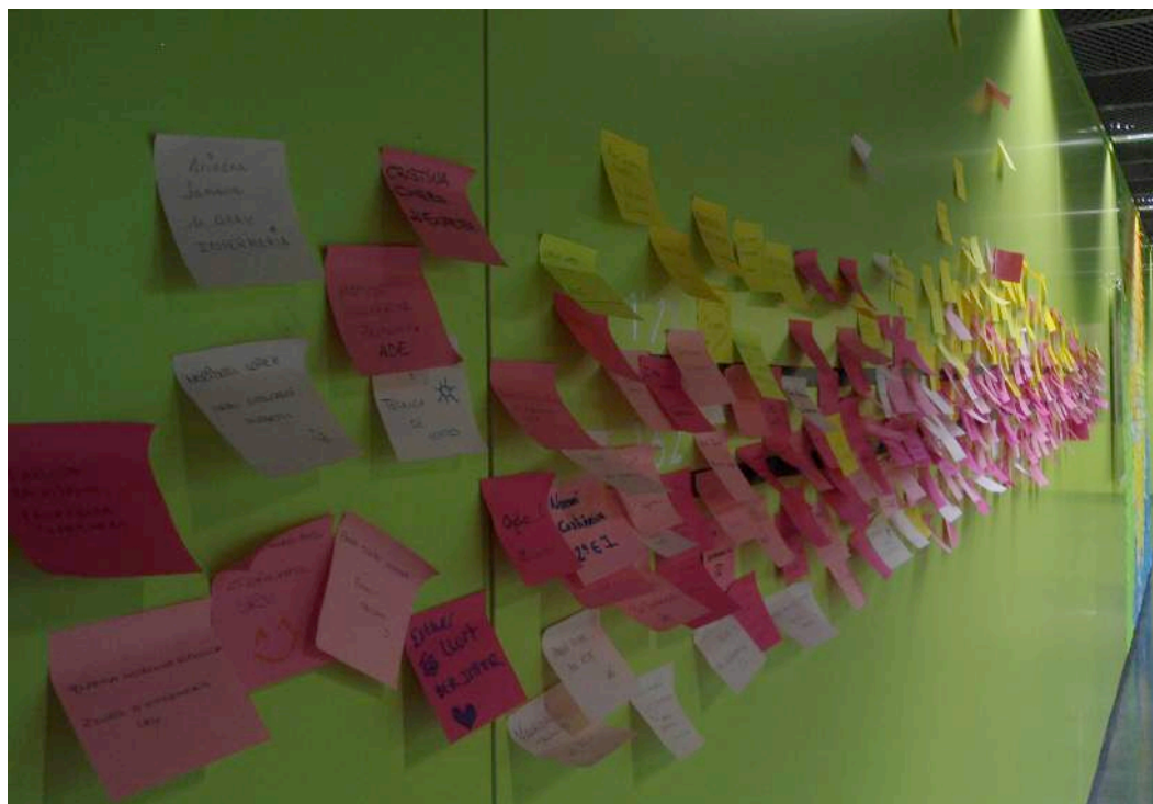
Figura 5. Participació dels estudiants. Acció paral·lela. Detall dels post-its enganxats.