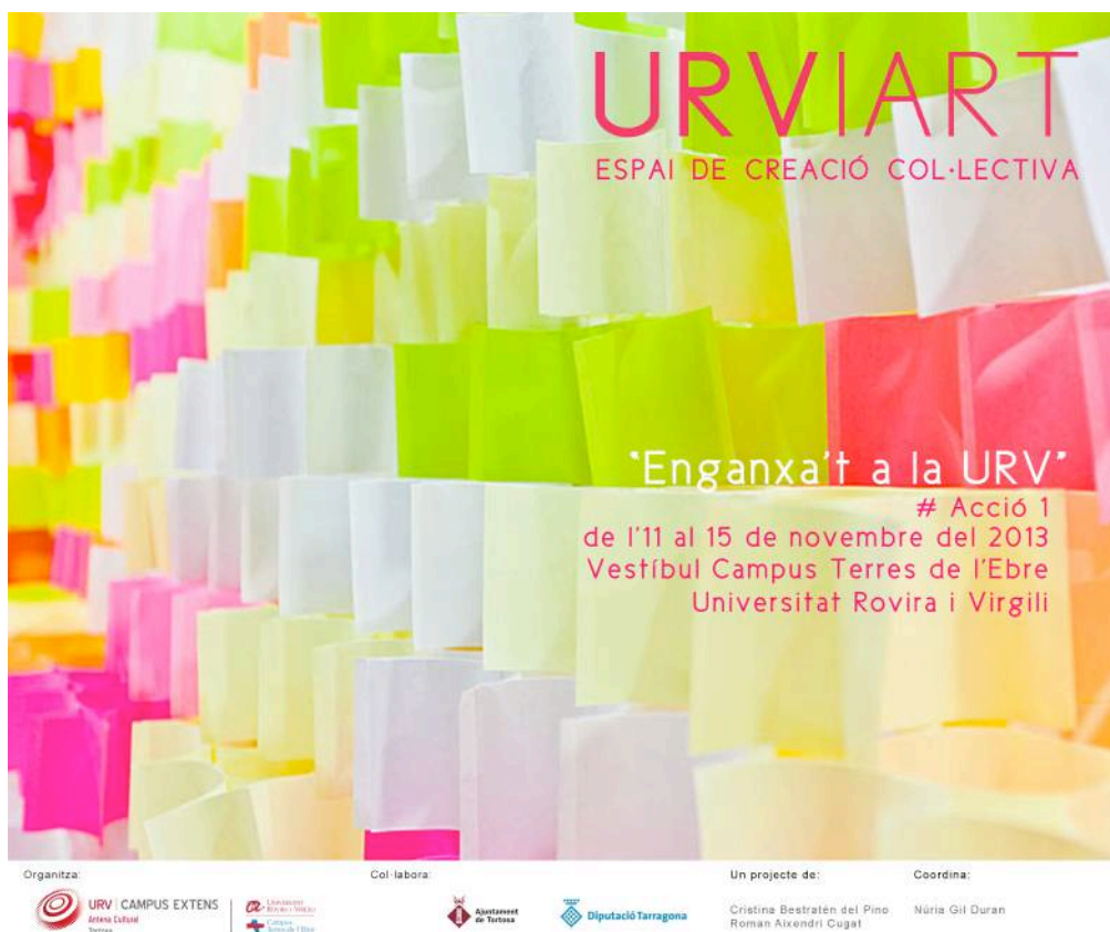
Figura 1. Targetó de presentació de l'acció.

Aquesta participació va ser comptabilitzada per les sol·licituds de post-its a consergeria i ratificada pels 298 post-its enganxats amb el redactat manuscrit i personal de cadascú, tal com s'havia indicat.