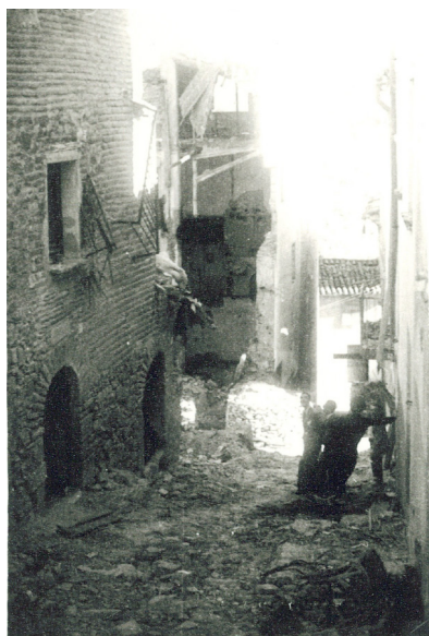
La plaça Major de Falset i alguns edificis malmesos pels bombardeigs de finals de juliol de 1938 a Falset