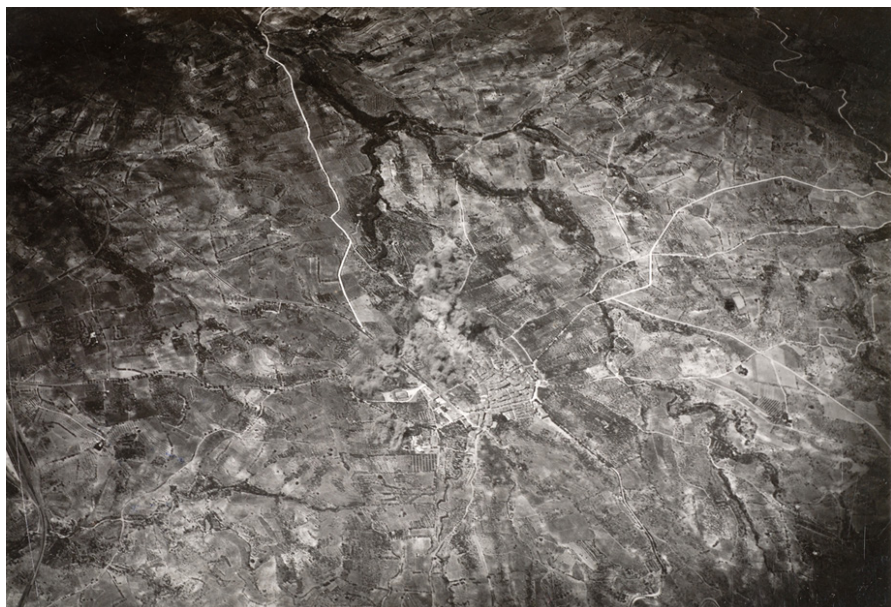
Bombardeig sobre Falset el 31 de juliol de 1938 (Arxiu Fotogràfic del CHCC)

El 2 d'agost de 1938, La Vanguardia publica un article del periodista Isidoro Corbinos, que es troba al front de l'Ebre, amb el títol «La batalla que