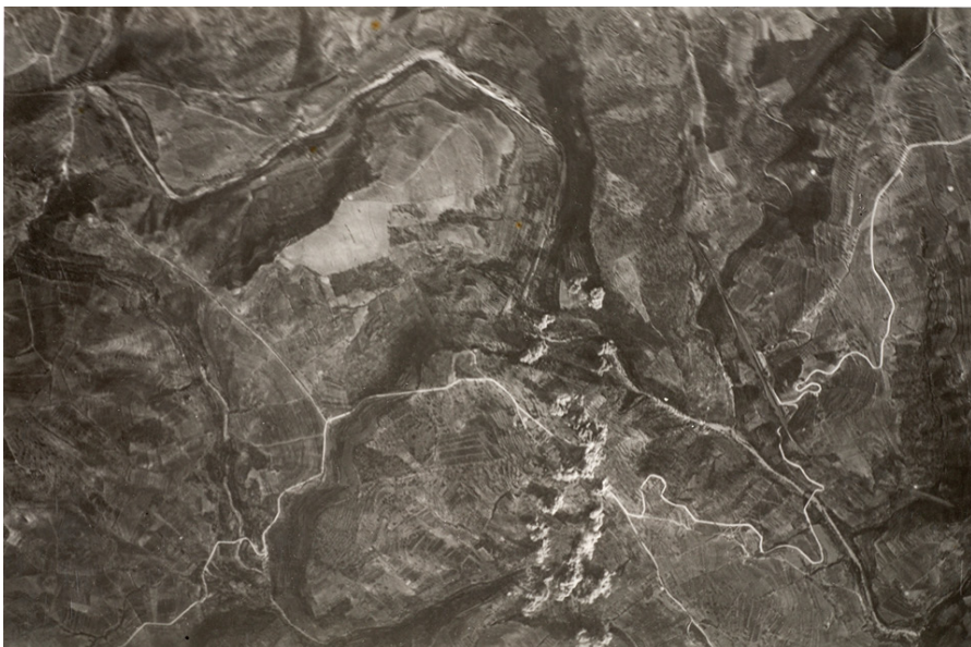
Bombardeig sobre els Guiamets el 31 de juliol de 1938 (USAM-OMS)