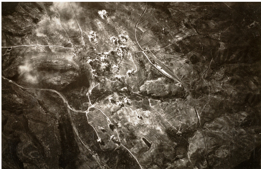
Bombardeig sobre Marçà el 30 de juliol de 1938

formada per una patrulla de tres aparells de la 289° i dos de la 285° descarreguen quaranta bombes de 100 kg contra la carretera i el poble de Marçà des dels 5.000 m (vegeu la imatge 8). Gairebé de manera simultània ho fan la segona i la tercera formacions contra les posicions i concentracions de forces al Masroig, des dels 4.350m, amb cinc aparells de la 281° esquadrilla, juntament amb cinc aparells més (tres de la 280a i dos de la 285a) vers les concentracions de forces a Falset des dels 4.500 metres (vegeu la imatge 9). Aquestes dues formacions deixaran anar la mateixa quantitat de bombes que la primera. En tots tres casos, la reacció antiaèria dels artillers republicans esdevé molt violenta. 29