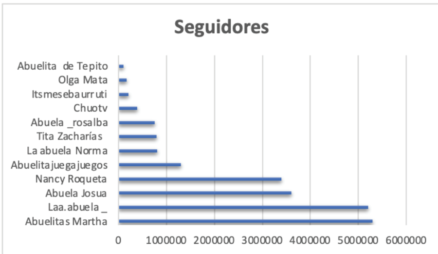
Figura 1 – Número de seguidores por cuenta

El análisis reveló una heterogeneidad significativa en el número de seguidores entre las cuentas estudiadas. Cuatro participantes superaron el umbral de un millón de seguidores, denotando un alcance considerable en la plataforma. Un caso notable es el de Rosalba de Colombia, quien experimentó un aumento notable de cincuenta mil seguidores solo en junio, posiblemente indicando una tendencia ascendente en la popularidad o la resonancia de su contenido con la audiencia.