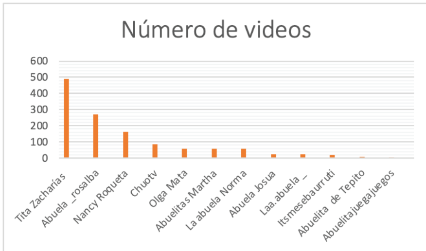
Figura 2 – Número de publicaciones de enero a junio

embargo, las cuentas que produjeron una cantidad mayor de videos tienden a explorar una diversidad de temáticas. Por ejemplo, Tita Zacharías de Argentina enfatizaba en temas personales y de salud, mientras que Rosalba de Colombia se inclinaba hacia retos de baile, posiblemente reflejando diferencias culturales o estrategias de contenido.