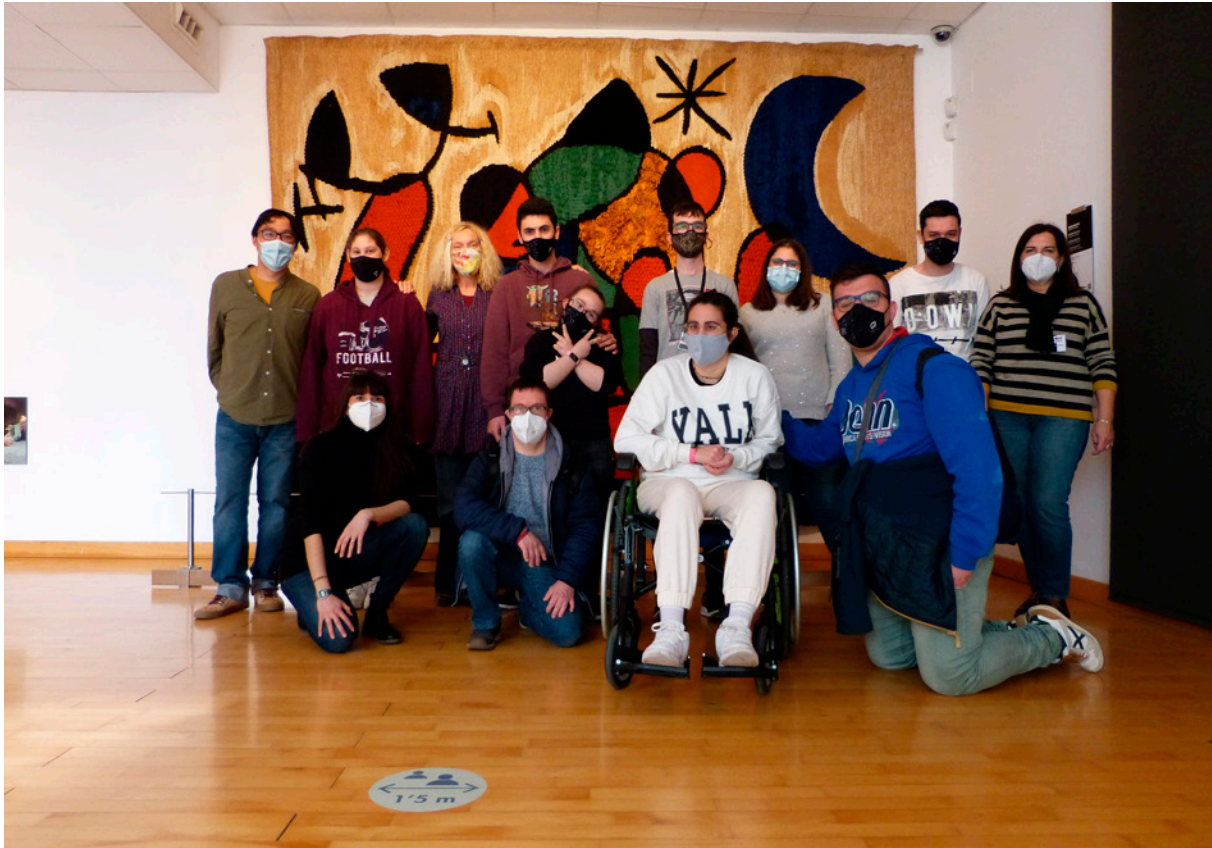
Grup INSERLAB. Diputació de Tarragona.

dura fins a l'actualitat. El MAMT ofereix a aquests grups un espai obert i acollidor que els participants puguin fer seu, i on les seves experiències, preocupacions i emocions es puguin posar en relació amb l'art, mentre aprenen l'idioma local amb l'activitat l'ABC del MAMT o coneixen el museu com a equipament cultural i el seu contingut. A partir del curs 2011-2012, es pren la decisió d'adaptar el calendari de visites per tal de dedicar un dia a la setmana als centres d'educació especial. El dia escollit és el dilluns, moment en el qual el museu està tancat al públic, però que obre les portes per acollir a aquests col·lectius i per poder disposar lliurement de l'espai sense limitacions de mobilitat, d'expressió, ni de sorolls. Les activitats que es realitzen amb aquests centres són totalment personalitzades