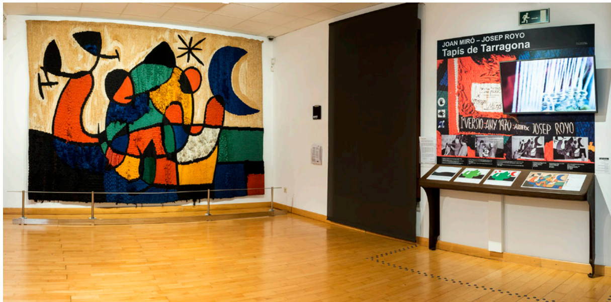
Mòdul tactovisual dedicat al Tapís de Tarragona . Diputació de Tarragona.

en diverses ocasions per adaptar-se a les necessitats dels usuaris, primer l'any 2010, després l'any 2016 que és la versió vigent ( https://www.dipta.cat/mamtpedagogic ), però que actualment es torna a trobar en procés de revisió.