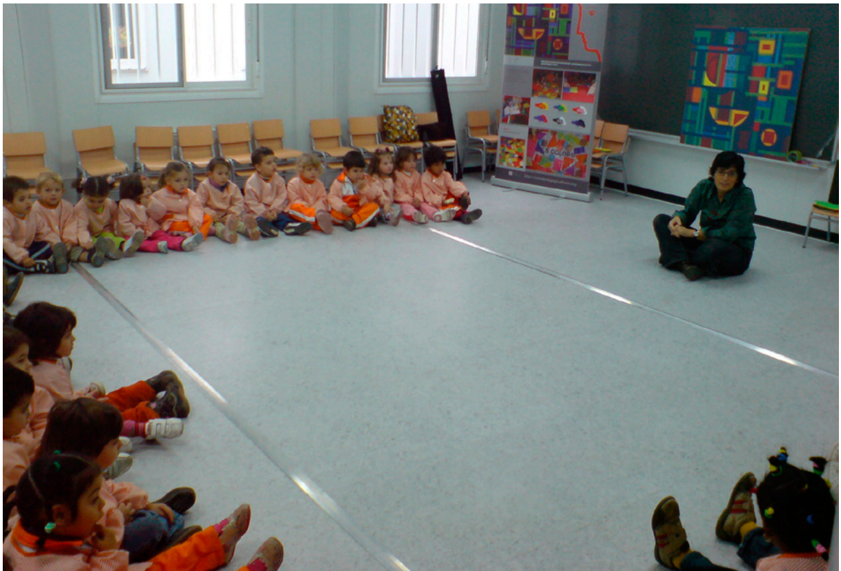
Les educadores del Servei Educatiu del MAMT treballant a les aules de les escoles de Tarragona. Diputació de Tarragona.

les col·leccions al públic ha estat una de les seves tasques fonamentals i a partir de l'any 1991, arran d'una important rehabilitació de l'edifici que suposà tot un canvi conceptual en l'estructura del museu, la tasca educativa es fa més forta. Fins aleshores, les visites es feien seguint un model convencional i les escoles no disposaven d'un material específic per poder treballar les col·leccions. És en aquell moment quan es crea el Servei Pedagògic del MAMT i Marisa Suárez, responsable de la comunicació i difusió del museu, es fa càrrec de la coordinació de les visites dels centres educatius de la ciutat, i s'ocupa de l'acollida dels grups. S'enceta un camí per apropar el museu a les escoles, oferint activitats dinamitzades als centres educatius de l'entorn immediat. En aquesta època s'editen els primers quaderns de treball sobre