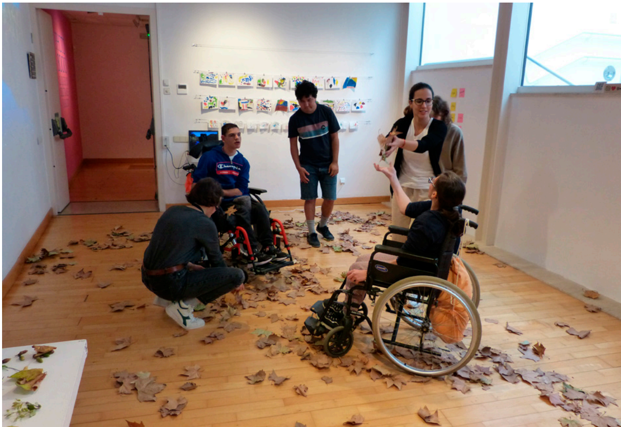
Alumnes del CEE Sant Rafael de Tarragona durant una visita al MAMT. Diputació de Tarragona.

possibilitat de conèixer algunes de les escultures que es troben a la via pública de Tarragona. Altres materials didàctics dissenyats ad hoc van ser el quadern de treball per a l'exposició Art del segle XX a les comarques de Tarragona i Bronze nu , una revisió de la figura històrica de l'escultor Julio Antonio (Alfonso-Benlliure et al. , 2025).