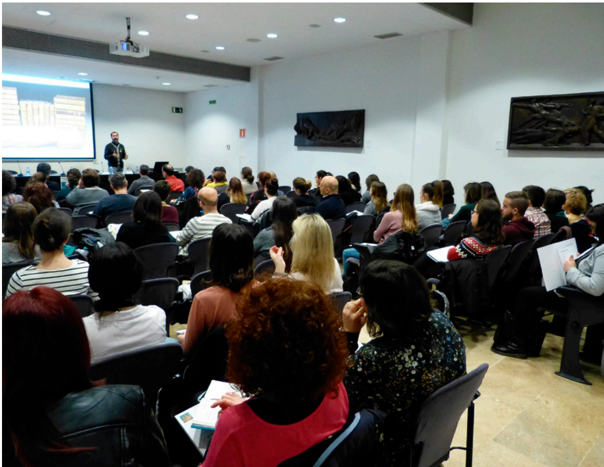
Imatge de la xv Jornada de Pedagogia de l'Art i Museus, 2018. Diputació de Tarragona.

propòsit de configurar una xarxa entre el museu i els centres educatius a partir del treball de proximitat amb les escoles (Jardón, Huerta, 2025). El projecte Ets un artista... i exposes al MAMT va tenir una primera etapa amb cinc edicions, des de l'any 2006 fins al 2011. Aquesta va ser una etapa de creixement i aprenentatge, i va evidenciar la necessitat de transformar la proposta per poder ampliar la participació en moltes més escoles que ho demandaven. En una segona etapa, durant el curs 2011-2012 es presenta Ets un artista... i exposes al MAMT. Calendari , que dona l'oportunitat de participar a tots els grups d'educació infantil, primària i educació especial que visiten el MAMT. A partir de les obres, els autors o la temàtica que es