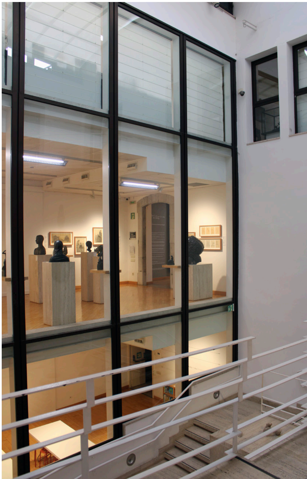
Pati del MAMT. Diputació de Tarragona.