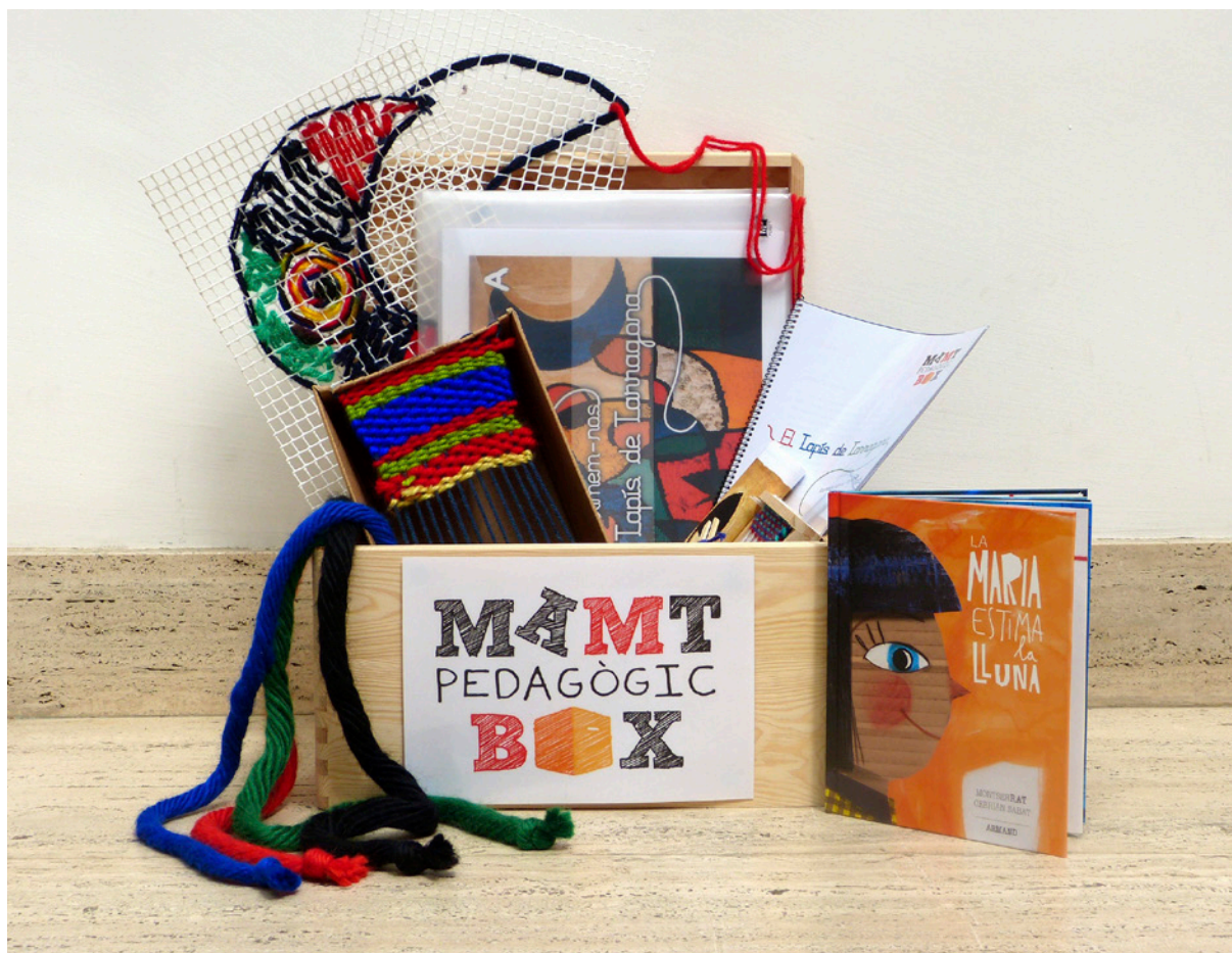
MAMT Pedagògic BOX. Diputació de Tarragona.

dora en relació amb la categoria «connectivitat». Se subratlla l'esforç per establir relacions entre significats possibles i temàtiques socials; posant en relació diferents contextos històrics i geogràfics. D'una forma similar, al taller es valora l'ús de metàfores al servei d'aquest tipus de connexions. Els aspectes «flexibilitat» i «originalitat» es perceben com a àmpliament reflectits també a l'activitat de taller.