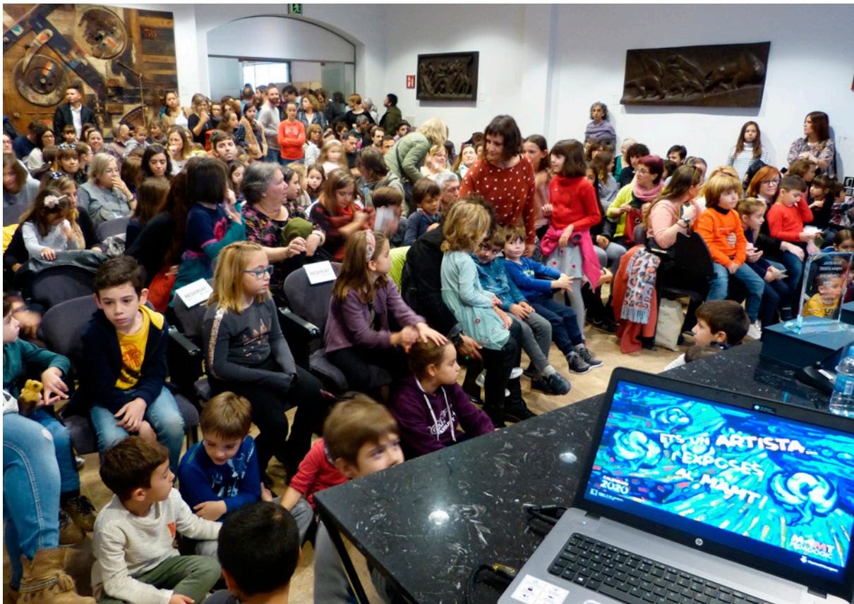
Acte d'inauguració de l'exposició del projecte Ets un artista... i exposés al MAMT , 2019. Diputació de Tarragona.

més veieu?», etc. La generació d'hipòtesis es va utilitzar també de manera sovintejada, sobretot en relació amb la interpretació, encoratjant els participants a proposar possibles significats (Salido-López, 2025).